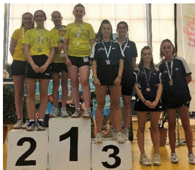
C19 (Double Mixte)