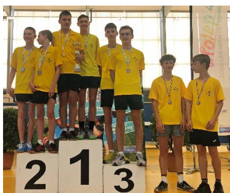
C18 (Double Dames)