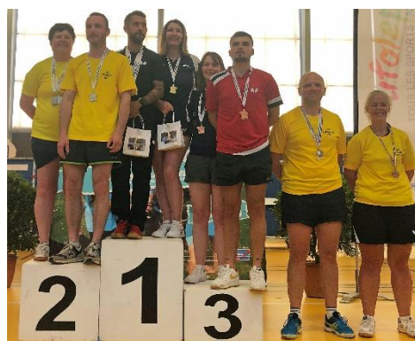
C17 (Double Messieurs)