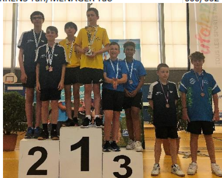
C21 (Doubles Garçons)